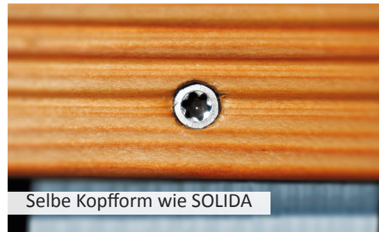
Selbe Kopfform wie SOLIDA